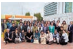
JAXA筑波宇宙センター前で