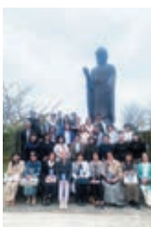
牛久大仏をバックに

つくば市にあるJAXA筑波宇宙センターの見学では、職員案内による見学ツアーで、一般には見学できない国際宇宙ステーションの最大の実験施設「きぼう」の管制室や、宇宙飛行士養成エリアなどを見学することができました。その後、フランス料理のランチをいただき、牛久大仏を見学し、成田山新勝寺を参拝いたしました。