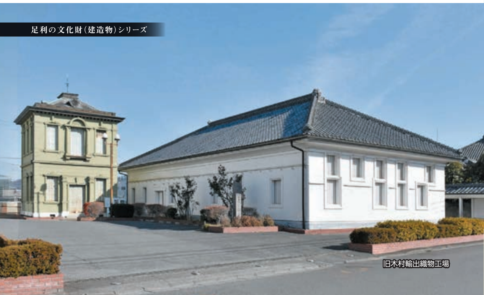
旧木村輸出織物工場