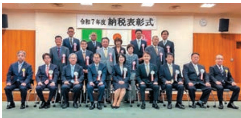
表彰された皆さん