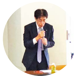
挨拶する板橋会長

去る11月9日(木)あしかがフラワーパークプラザ301号室にて、33名の役員等の方々のご出席をいただき、令和5年度第2回理事会を開催いたしました。