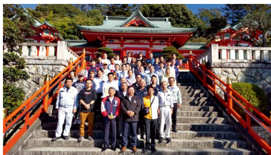
織姫神社清掃奉仕参加者の皆さん