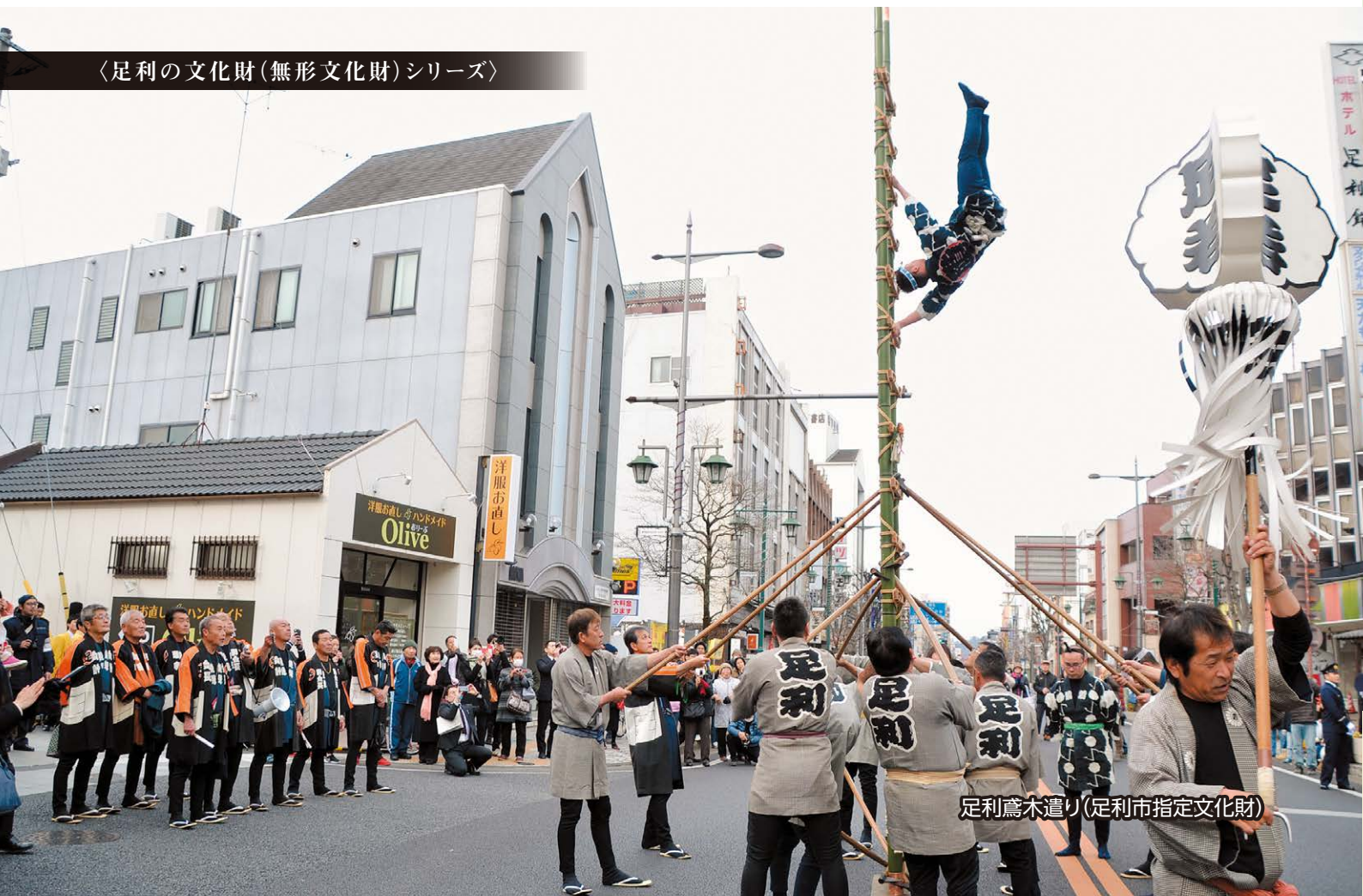
足利鷺木遣り(足利市指定文化財)