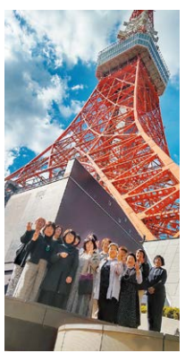
日帰り見学研修会参加の皆さん

10月24日(火)、女性部会主催の日帰り見学研修会「アフターコロナの浅草視察と東京タワートップデッキツアー」を15名の方々のご参加をいただき実施いたしました。