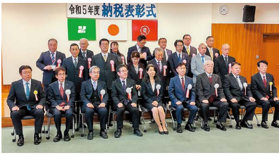
表彰された皆さん

最後に、来場者対象に大抽選会が行われ、イベント参加者の多くの方々が豪華賞品を当て、盛大のうちにイベントの幕を閉じることができました。